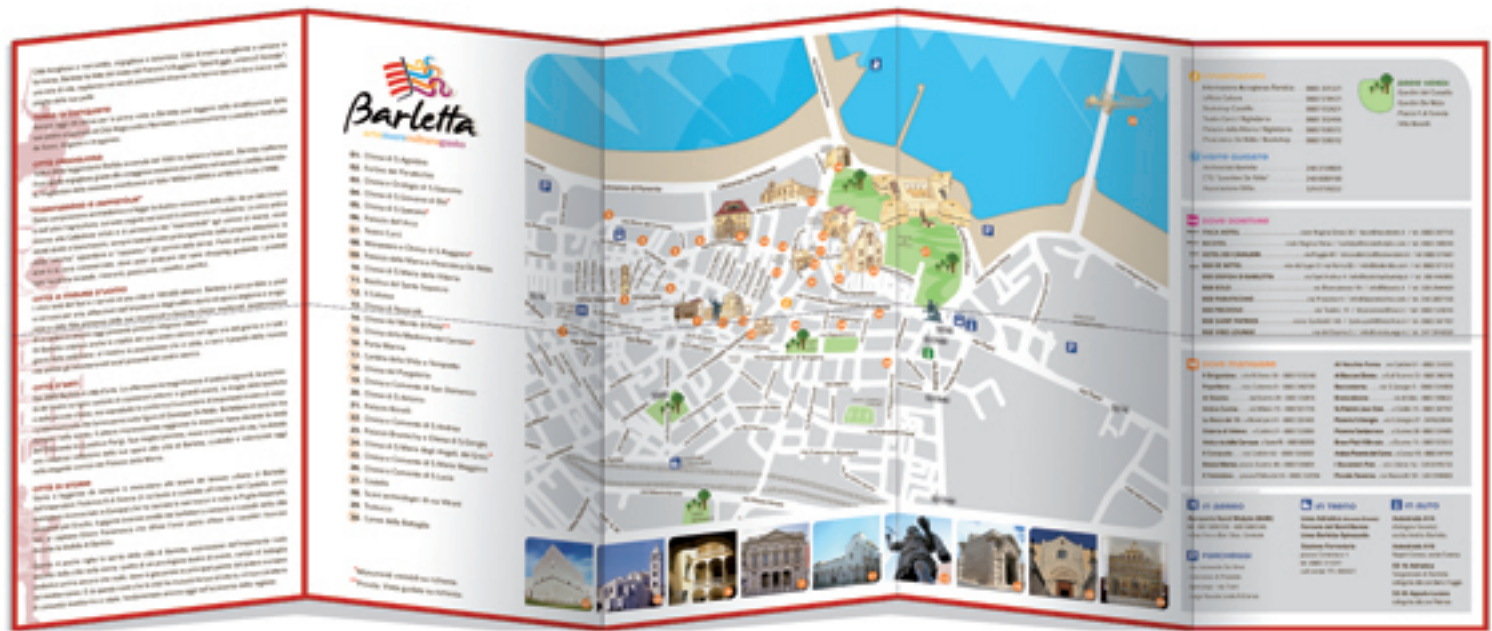
mapa dei beni culturali disponibili presso IAT, URP, Bookshop Pinacoteca De Nittis, Bookshop del Castello