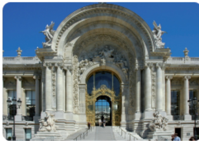
( PETIT PALAIS PARIGI )

Finalmente quadri, armi, monete e oggetti, insieme alle marionette della collezione Immesi, potranno tornare in bella vista in un contesto organizzato, funzionale e ricettivo.