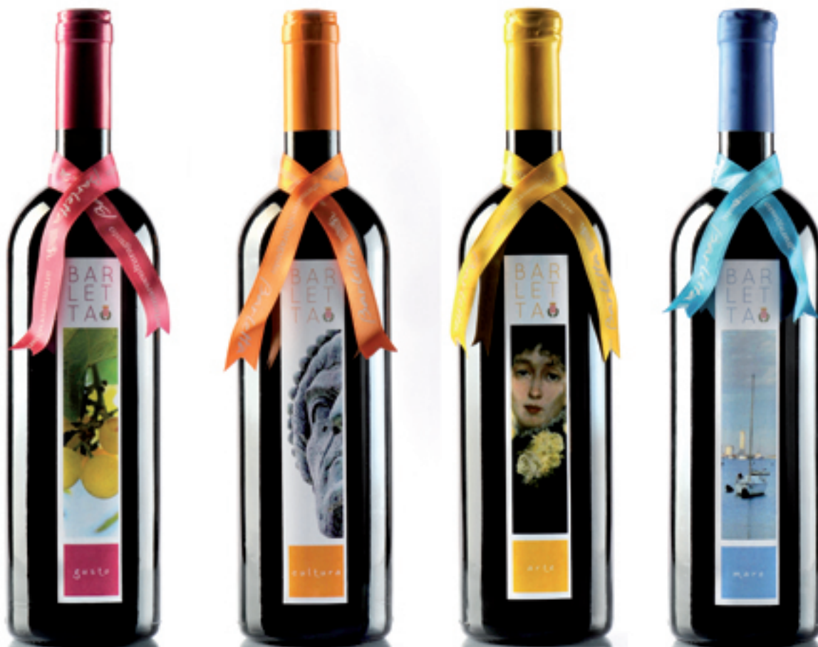
Nero di Troia 2007 in purezza